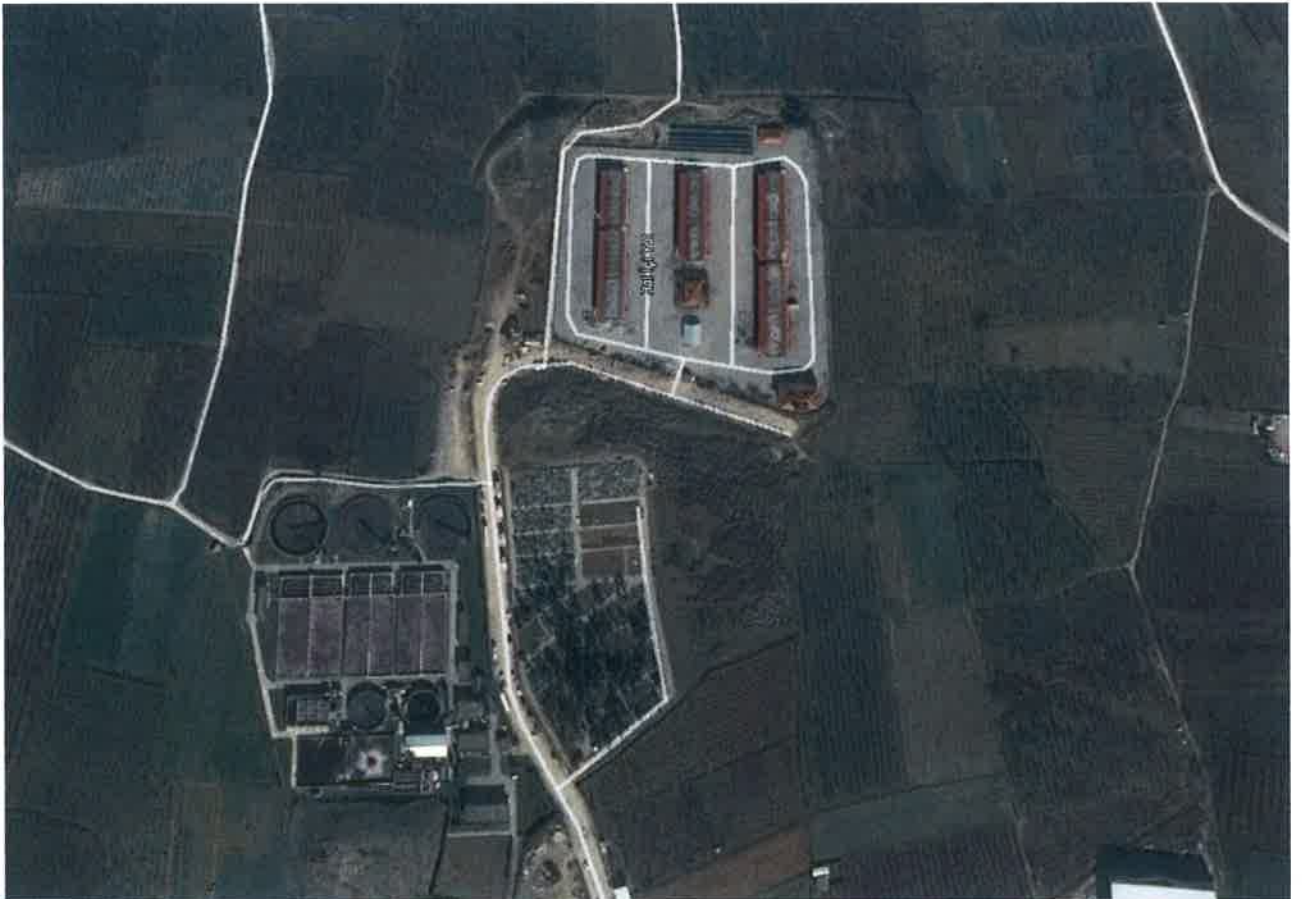
Planlama Alanını Gösterir Uydu Haritası

Gürsu, Bursa kent merkezinin kuzeydoğu bölümünde, Bursa kent merkezine yaklaşık 15 km mesafededir. 40'ıncı kuzey enlemi ile 28–30 doğu boylamı arasında yer alır. Bursa-İnegöl-Ankara Karayolu üzerinde, karayolunun kuzeyinde ve karayoluna yaklaşık 2 km mesafede, Bursa Ovası'nın doğu bölümü konumlanmıştır. İlçe'nin doğusunda İnegöl, batısında Yıldırım ve Osmangazi, kuzeyinde Gemlik, güneyinde Kestel ilçeleri ile çevrili olup deniz seviyesinden 100 m. yüksektedir.